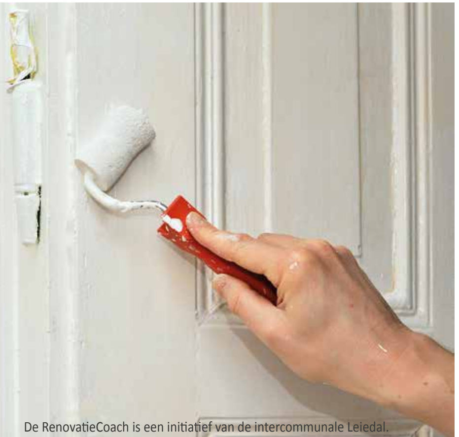
De RenovatieCoach is een initiatief van de intercommunale Leiedal.

Via www.mijnenergiekompas.be kan je zelf ontdekken hoe energiezuinig je woning is en vooral hoe energiezuinig je woning zou kunnen zijn na een gerichte renovatie.