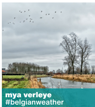
mya verleye #belgianweather