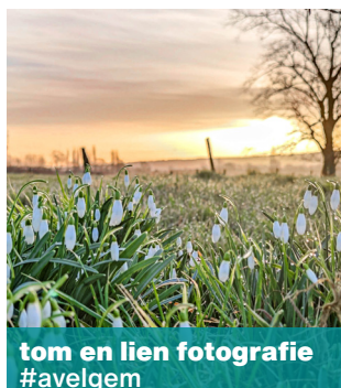
tom en lien fotografie #avelgem